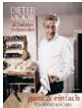
ganz & einfach tempofrei kochen Dieter Moor & Sabine Schneider